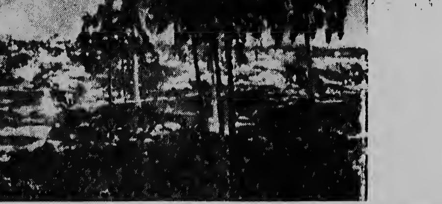
Lava su vlamnan ta spat na loria i ta forma destruccion na unda cu e cai. Nada no ta scapa camina o cal den su cercania inmediata. Palunan di papaya den cunucunan na Hawaii ta queda su victimanan. E vulcan aki ta forma un gran peliger pa e ciudad di Kapoho.

Experionan ta di opinion cu e problema mas grandi no ta asina tantu riba terreno politico pero riba terreno economico. Honduras Ingles casi no tin habitante y e ta atrasa; el a nenga di bira miembro dje federacion di islanan Ingles den Caribe y e ta depende hopi di subvencionnan di go- bierno Ingles.